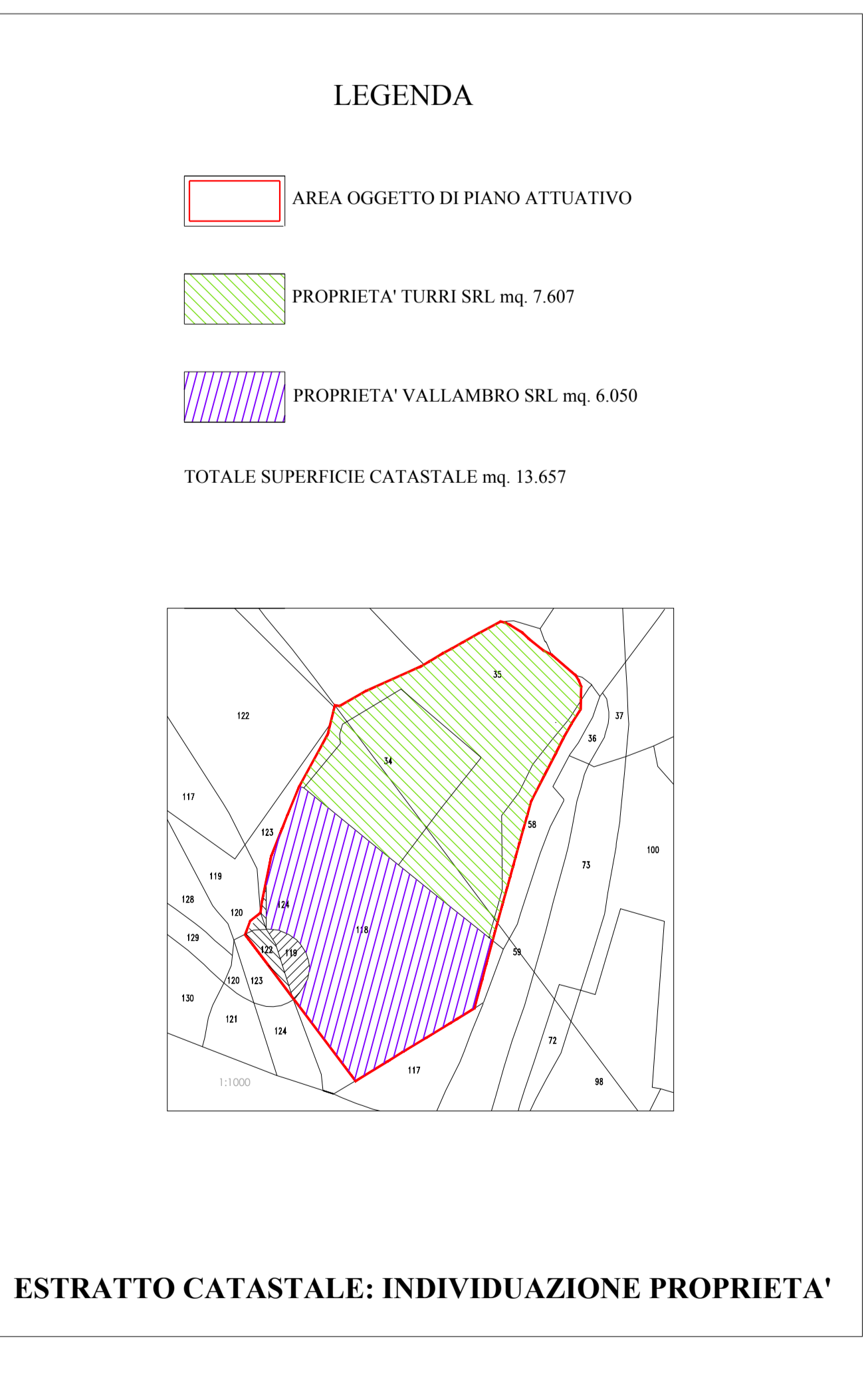
ESTRATTO CATASTALE: INDIVIDUAZIONE PROPRIETA'