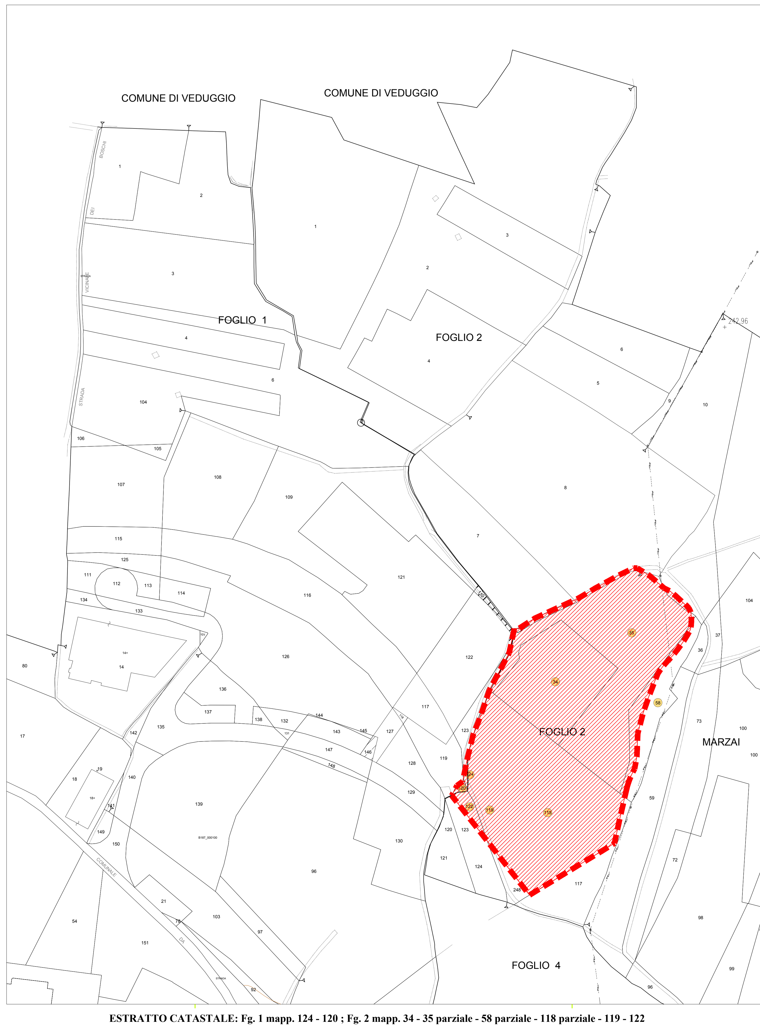
ESTRATTO CATASTALE: Fig. 1 mapp. 124 - 120 ; Fig. 2 mapp. 34 - 35 parziale - 58 parziale - 118 parziale - 119 - 122